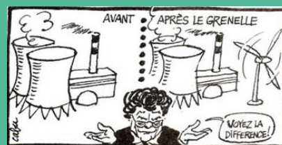
Le Canard Enchaîné 23.04.08

L'éolien industriel, présenté comme une solution au problème nucléaire, est devenu la caution du nucléaire !